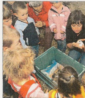
Vor einer Stunde sind junge Kälblein auf die Welt gekommen.